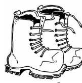
goede stevige schoenen