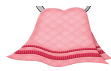
droge kleren en handdoek op vrijdag