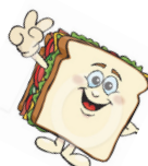
iedere dag boterhammen