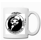
beker met naam