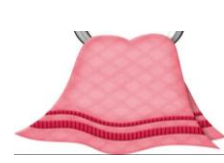
droge kleren en handoek op vrijdag