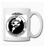
beker met naam