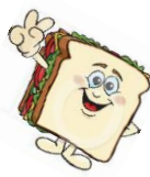
iedere dag boterhammen