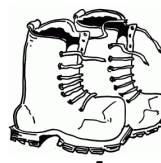
goede stevige schoenen