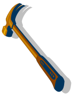
hamer met naam